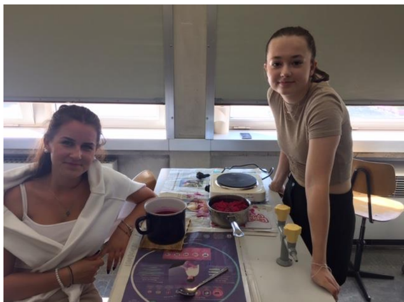
T-Shirts im Färbebad