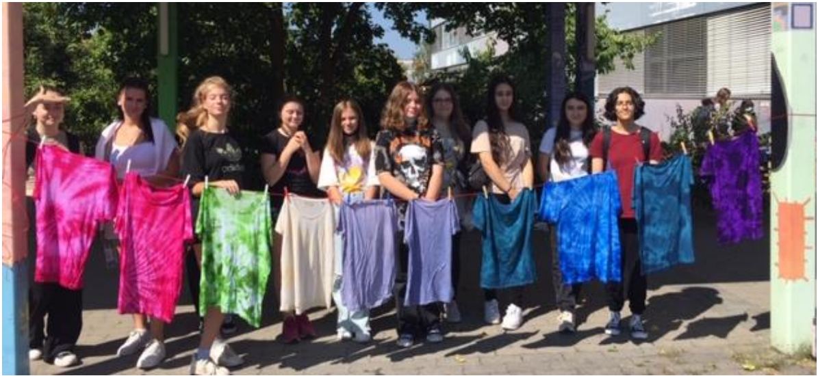
Das Batik Ergebnis